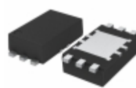
BD3507HFV-TR Rohm Semiconductor IC REG LDO ADJ 0.55A 6HVSOF