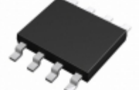
BD3501FVM-TR Rohm Semiconductor IC REG CTRLR SGL 1.5V 8MSOP