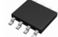
BD3504FVM-FTR Rohm Semiconductor IC REG LDO ADJ 8MSOP