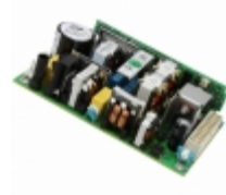
NVM100015 TDK-Lambda Americas, Inc. AC/DC CONVERTER 12V 180W