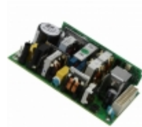
NVM100026 TDK-Lambda Americas, Inc. AC/DC CONVERTER 24V 180W