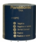
ECE-P2DA392HX Panasonic Electronic Components CAP ALUM 3900UF 20% 200V SNAP