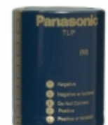
ECE-P2AP153HA Panasonic Electronic Components CAP ALUM 15000UF 20% 100V SNAP