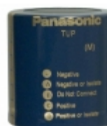
ECE-P2AP103HA Panasonic Electronic Components CAP ALUM 10000UF 20% 100V SNAP