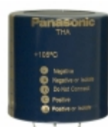
ECE-P2AA822HA Panasonic Electronic Components CAP ALUM 8200UF 20% 100V SNAP