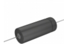
TC1266 Cornell Dubilier Electronics (CDE) CAP ALUM 160UF 250V AXIAL