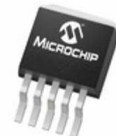
TC1265-3.0VETTR Microchip Technology IC REG LDO 3V 0.8A DDPACK