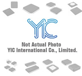
LT1776IS8 LT LT1776IS8 LT