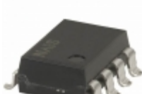
AQW414AX Panasonic RELAY OPTO AC/DC 400V 100MA 8SMD