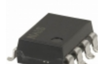
AQW414EHA Panasonic RELAY OPTO DPST-NC 100MA 400V