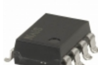
AQW414EHAX Panasonic SSR RELAY DPST-NC 100MA 0- 400V