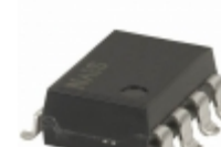
AQW414A Panasonic RELAY OPTO DPST-NC 100MA 400V