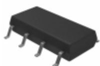
AQW410S Panasonic RELAY OPTO DPST-NC 100MA 8SOP