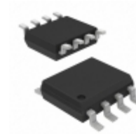
HCPL0453R1 Fairchild/ON Semiconductor OPTOCOUPLER TRANS 1CHAN HS 8SOIC