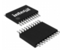
HIP6004BCV-T Intersil IC CTRLR PWM VOLTAGE MON 20TSSOP