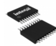
HIP6004BCV Intersil IC CTRLR PWM VOLTAGE MON 20TSSOP