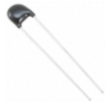
ERZ-E05A201CS Panasonic Electronic Components VARISTOR 200V 1.2KA DISC 7MM