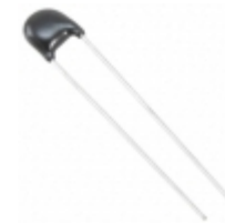
ERZ-E05A241CS Panasonic Electronic Components VARISTOR 240V 1.2KA DISC 7MM