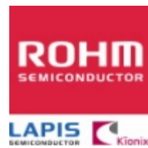
2SCR512PFRA ROHM 2SCR512PFRA ROHM