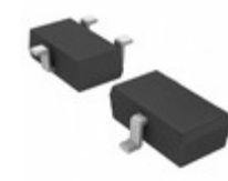
2SCR512RTL Rohm Semiconductor TRANS NPN 30V 2A TSMT3