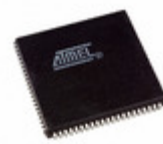
AT40K05AL-1AJC Microchip Technology IC FPGA 62 I/O 84PLCC