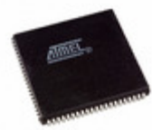
AT40K05LV-3AJI Microchip Technology IC FPGA 3.3V 256 CELL 84-PLCC