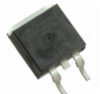
IXFY4N85X IXYS MOSFET N-CH 850V 3.5A TO252-3