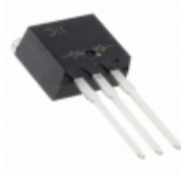
SBR30A100CTE-G Diodes Incorporated DIODE SBR 15A 100V TO262