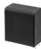
MKP1848C61012JP4 Vishay BC Components CAP FILM 10UF 5% 1.2KVDC RAD 4LD