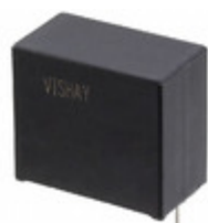
MKP1848C61012JY2 Electro-Films (EFI) / Vishay CAP FILM 10UF 5% 1.2KVDC RADIAL