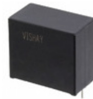
MKP1848C61010JP2 Vishay BC Components CAP FILM 10UF 5% 1KVDC RADIAL