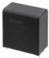
MKP1848C61010JP4 Electro-Films (EFI) / Vishay CAP FILM 10UF 5% 1KVDC RAD 4LD