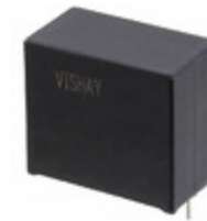
MKP1848C61010JP2 Electro-Films (EFI) / Vishay CAP FILM 10UF 5% 1KVDC RADIAL