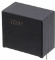
MKP1848C61012JP2 Vishay BC Components CAP FILM 10UF 5% 1.2KVDC RADIAL