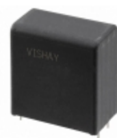
MKP1848C59090JP4 Vishay BC Components CAP FILM 9UF 5% 900VDC RAD 4LD