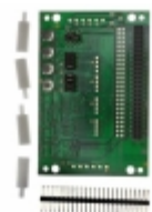
20-101-1253 Digi International BOARD SERIAL COMM RCM56/57XX