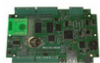
20-101-1258 Digi International COMPUTER SINGLE-BOARD BL4S160