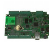
20-101-1256 Digi International COMPUTER SINGLE-BOARD BL4S110