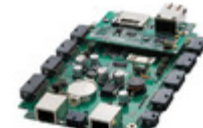
20-101-1259 Digi International COMPUTER SINGLE-BOARD BL4S210