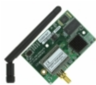
20-101-1247 Digi International CORE MODULE RCM5450W