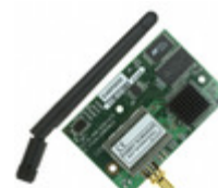
20-101-1246 Digi International CORE MODULE RCM5400W