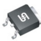
TSM60NB1R4CP ROG TSC (Taiwan Semiconductor) MOSFET N-CHANNEL 600V 3A TO252