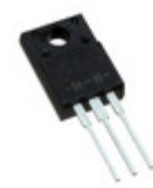
TSM60NB190CI COG TSC (Taiwan Semiconductor) MOSFET N-CH 600V 18A ITO220