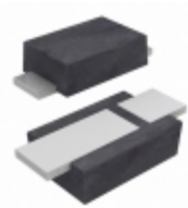
SMD22HE-TP Micro Commercial Co DIODE SCHOTTKY 20V 2A SOD123HE