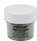
SMD2215-25000 Chip Quik, Inc. SOLDER SPHERES SN63/PB37 .030" D