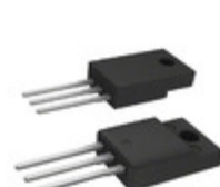
ACST2-8SFP STMicroelectronics TRIAC SENS GATE 800V TO220FPAB