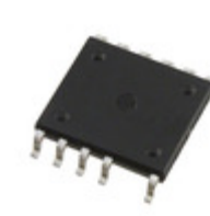
TOP267KG Power Integrations IC OFFLINE SW 45W 65W 12ESOP