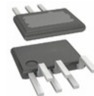
TOP268EG Power Integrations IC OFFLINE SW PWM OCP OVP 7ESIP