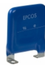
LS40K320QP EPCOS (TDK) VARISTOR 510V 40KA CHASSIS