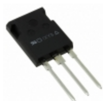
IXTR90P20P IXYS MOSFET P-CH 200V 53A ISOPLUS247