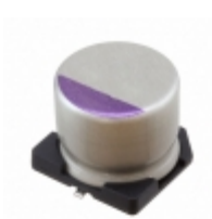
63SXV39MX Panasonic SXV SERIES - OSCON SMD TYPE 63V