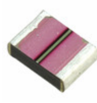
63ST684MC14532 Rubycon CAP FILM 0.68UF 20% 63VDC 1812