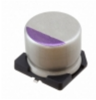
63SXV33M Panasonic Electronic Components CAP ALUM POLY 33UF 20% 63V SMD