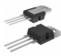
MIC29150-3.3BT Microchip Technology IC REG LDO 3.3V 1.5A TO220-3