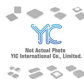
MIC29150-3.3BUTR MICREL MICREL TO263