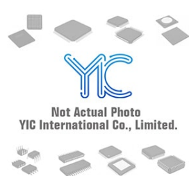
MIC29150-2.5WU Micrel Micrel TO-263