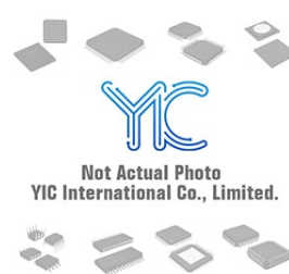
MIC29150-2.5BU Micrel Micrel TO-263