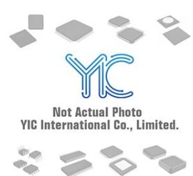
MIC29150-3.3WU TR MICREL MICREL TO263