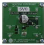
NCP785AH50GEVB AMI Semiconductor / ON Semiconductor EVAL BOARD NCP785AH50G