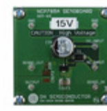
NCP785AH150GEVB AMI Semiconductor / ON Semiconductor EVAL BOARD NCP785AH150G