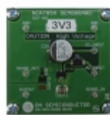
NCP785AH33GEVB AMI Semiconductor / ON Semiconductor EVAL BOARD NCP785AH33G