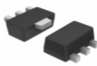
NCP785AH150T1G ON Semiconductor IC REG LDO 15V 10MA