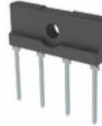
TS10KL80HD3G TSC (Taiwan Semiconductor) BRIDGE RECT 1PHASE 800V 10A KBJL