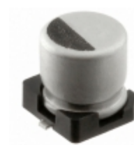
AVRF107M06C12T-F Cornell Dubilier Electronics (CDE) CAP ALUM 100UF 20% 6.3V SMD