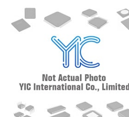
N74F00D.623 NXP NXP SOP14