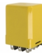
CLH-45-30010 Agastat Relays / TE Connectivity RELAY TIME DELAY 10SEC 10A 277V