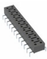
CLH-112-F-D-PE Samtec, Inc. LOW PROFILE/SMT STRIPS