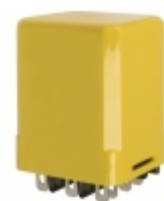
CLH-41-20030 Agastat Relays / TE Connectivity RELAY TIME DELAY 30SEC 10A 277V