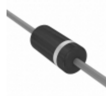
HER202-TP Micro Commercial Components (MCC) DIODE GPP HE 2A DO-15