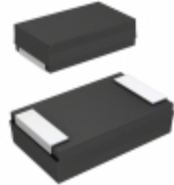
20TQC33MYFD Panasonic Electronic Components CAP TANT POLY 33UF 20V 2917