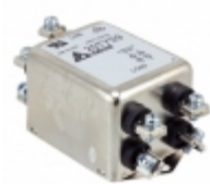
20TYS9 Delta Electronics LINE FILTER 440VAC 20A CHASS MNT