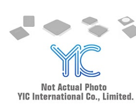
DSEI30-06C IGBT Module IGBT Modules