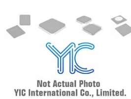
DSEI30-10 IGBT Module IGBT Modules