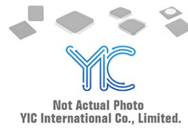
74LVCH244APWR TSSOP20 TI TI TSSOP20