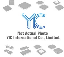
LT4430MPS6 LT LT4430MPS6 LT