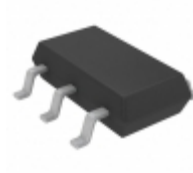
LT4430IS6#TRMPBF ADI (Analog Devices, Inc.) IC OPTOCOUPLER GATE DRVR SOT23-6