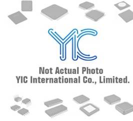
LT4430HS6 LT LT4430HS6 LT