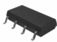
PS7141L-2B-A CEL (California Eastern Laboratories) SSR OCMOS FET 150MA NC 8-SMD