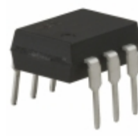
PS7142-1B-A CEL (California Eastern Laboratories) SSR OCMOS FET 200MA 1CH NC 6-DIP