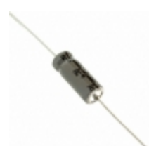
337TTA050M Illinois Capacitor AXIAL E-CAP