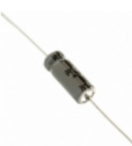
337TTA100M Illinois Capacitor CAP ALUM 330UF 20% 100V AXIAL