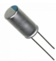
337ULR6R3MEF Illinois Capacitor CAP ALUM POLY 330UF 20% 6.3V T/H