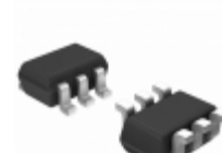
BGU7033,115 NXP USA Inc. IC AMPLIFIER MMIC LNA 6TSSOP