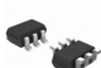
BGU7031,115 NXP USA Inc. IC AMP MMIC LNA 6TSSOP