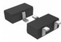
BD49K59G-TL LAPIS Semiconductor STANDARD VOLTAGE DETECTORS