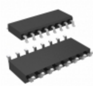
MAX364ESE Maxim Integrated IC SWITCH QUAD SPST 16SOIC