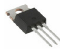
IRF634PBF Electro-Films (EFI) / Vishay MOSFET N-CH 250V 8.1A TO-220AB