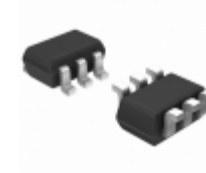
XP0654300L Panasonic Electronic Components TRANS 2NPN 10V 0.065A SMINI6