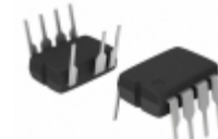
NCP1216P133G ON Semiconductor IC CTRLR PWM CM OTP HV 8DIP