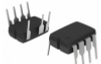
NCP1216P133 ON Semiconductor IC CTRLR PWM CM OTP HV 8DIP