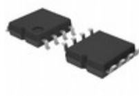
BR93G86F-3BGTE2 LAPIS Semiconductor MICROWIRE BUS 16KBIT(1024X16BIT)