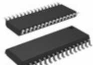
AT27C080-15RC Microchip Technology IC OTP 8MBIT 150NS 32SOIC