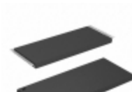
AT27C080-15TC Microchip Technology IC OTP 8MBIT 150NS 32TSOP