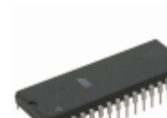
AT27C080-15PC Microchip Technology IC OTP 8MBIT 150NS 32DIP