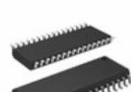
AT27C080-15RI Microchip Technology IC OTP 8MBIT 150NS 32SOIC