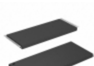
AT27C080-12TI Microchip Technology IC OTP 8MBIT 120NS 32TSOP