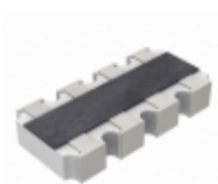
YC164-FR-079K1L Yageo RES ARRAY 4 RES 9.1K OHM 1206