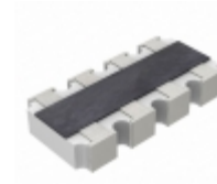
YC164-JR-07100KL Yageo RES ARRAY 4 RES 100K OHM 1206