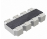
YC164-JR-0710KL Yageo RES ARRAY 4 RES 10K OHM 1206