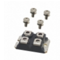
DHG50X1200NA IXYS DIODE MODULE 1.2KV 25A SOT227B