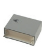
R463R415000M1K KEMET CAP FILM 1.5UF 10% 630VDC RADIAL