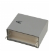
R463R422000M1M KEMET CAP FILM 2.2UF 20% 630VDC RADIAL