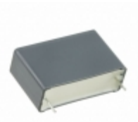
R463R410000M1K KEMET CAP FILM 1UF 10% 630VDC RADIAL