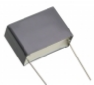
R463R415050M1K KEMET CAP FILM 1.5UF 10% 630VDC RADIAL