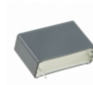
R463R410040M1K KEMET CAP FILM 1UF 10% 630VDC RAD