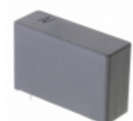
R463R410000M1M KEMET CAP FILM 1UF 20% 630VDC RADIAL