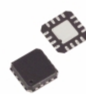
MAX4523EGE+T Maxim Integrated IC SW QUAD ANLG LV SPST 16QFN