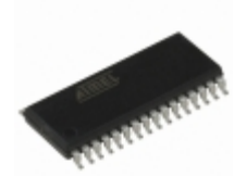
AT28C010-20SI Microchip Technology IC EEPROM 1MBIT 200NS 32SOIC