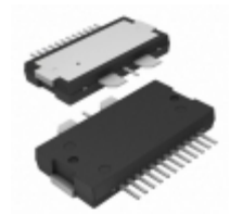
A2I09VD030NR1 NXP Semiconductors / Freescale IC RF AMP TO270WB-15