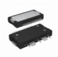
A2I20D020NR1 NXP Semiconductors / Freescale IC AMP W-CDMA 1.4-2.2GHZ TO270WB