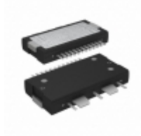
A2I20D020GNR1 NXP Semiconductors / Freescale IC AMP W-CDMA 1.4-2.2GHZ TO270