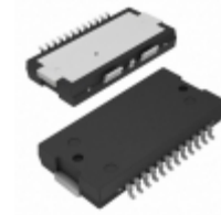
A2I20H060GNR1 NXP USA Inc. IC TRANS RF LDMOS