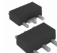
RT9069-25GX5 Richtek USA Inc. IC REG LDO 2.5V 0.2A SOT89-5